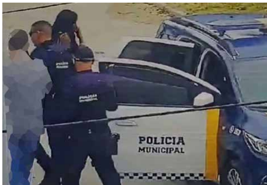
O Muralha Paulista é uma plataforma integrada que conecta bases de dados criminais e informações de segurança de diversos órgãos

A integração do sistema de monitoramento de São Sebastião ao programa estadual Muralha Paulista resultou, nesta quinta-feira (9), na primeira prisão realizada com apoio da nova tecnologia. A ação contou com o trabalho do Centro de Operações Integradas (COI) e da Polícia Municipal. As câmeras inteligentes identificaram um veículo Honda CR-V preto ligado a um empresário de 60 anos que possuía mandado de prisão expedido pela Vara da Família de Santo Amaro, na capital paulista, por dívida de pensão alimentícia superior a R$ 750 mil. Após a leitura automática da placa, o sistema gerou um alerta imediato na central do COI, permitindo o acompanha-